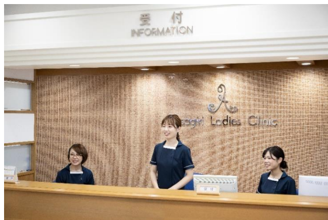
医院の顔として患者様のお出迎えをしています

医師、助産師、看護師等と連携を取りながら 日々医療の現場で忙しくも充実した毎日です。 患者様はもちろんスタッフに対しても笑顔を忘れず 「自分以外は皆お客様」を意識して職務に取り組む 姿勢は院内外より高く評価をいただいています。 現在20代～30代の医療事務スタッフが活躍中！ 丁寧な指導体制を整えておりますので、未経験でも ご安心下さい。