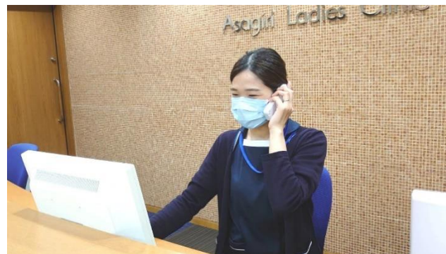
電話対応も大切なお仕事のひとつです