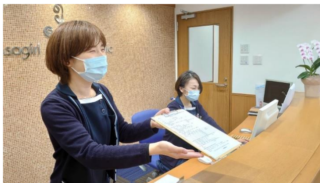
受付にて様々な対応をしております