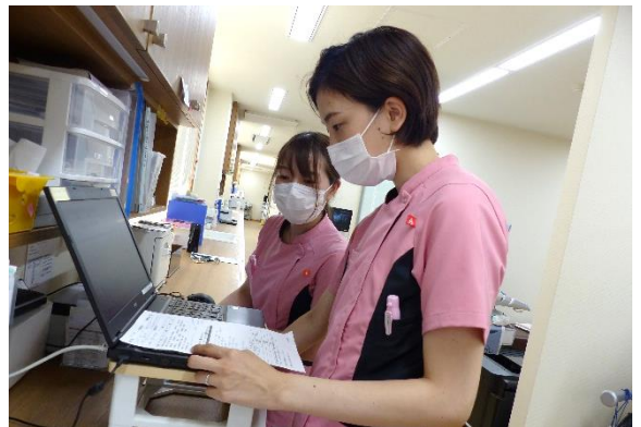
＜電子カルテの入力＞