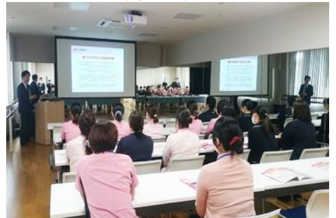
医薬品・予防接種等の説明会