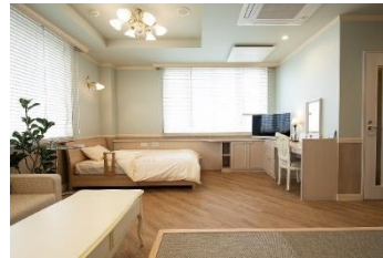
ファミリールーム