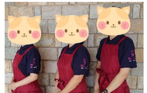
意気込みの表れ！？ 袖に当院ロゴを入れました♪