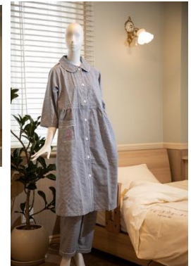
当院オリジナルパジャマ